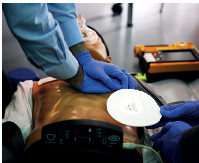
Sala de Reanimación