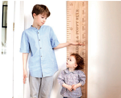
Crecimiento y Desarrollo