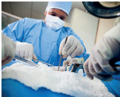
Sala de Procedimientos