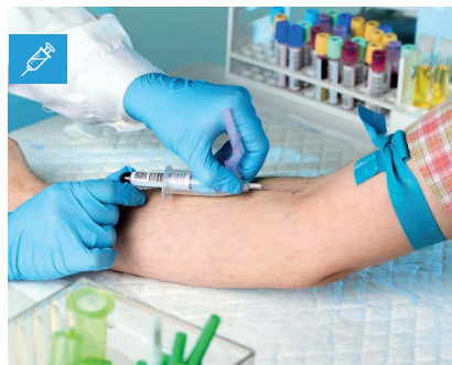
Toma de Muestra