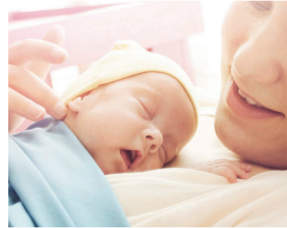
Atención al Recien Nacido