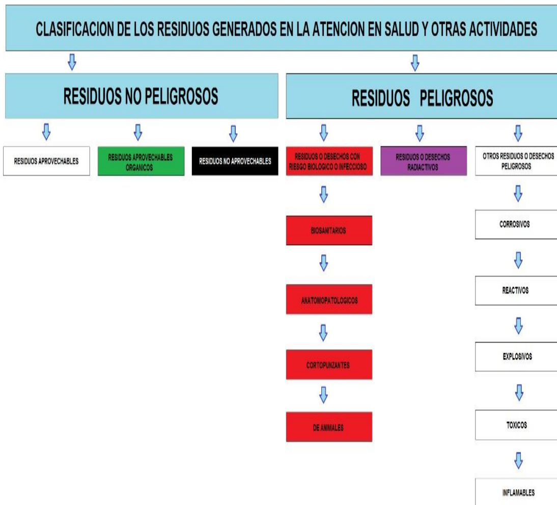
Figura No. 4.1. Clasificación de residuos generados en atención en salud y otras actividades.

Identificación, clasificación y cuantificación de los residuos generados.