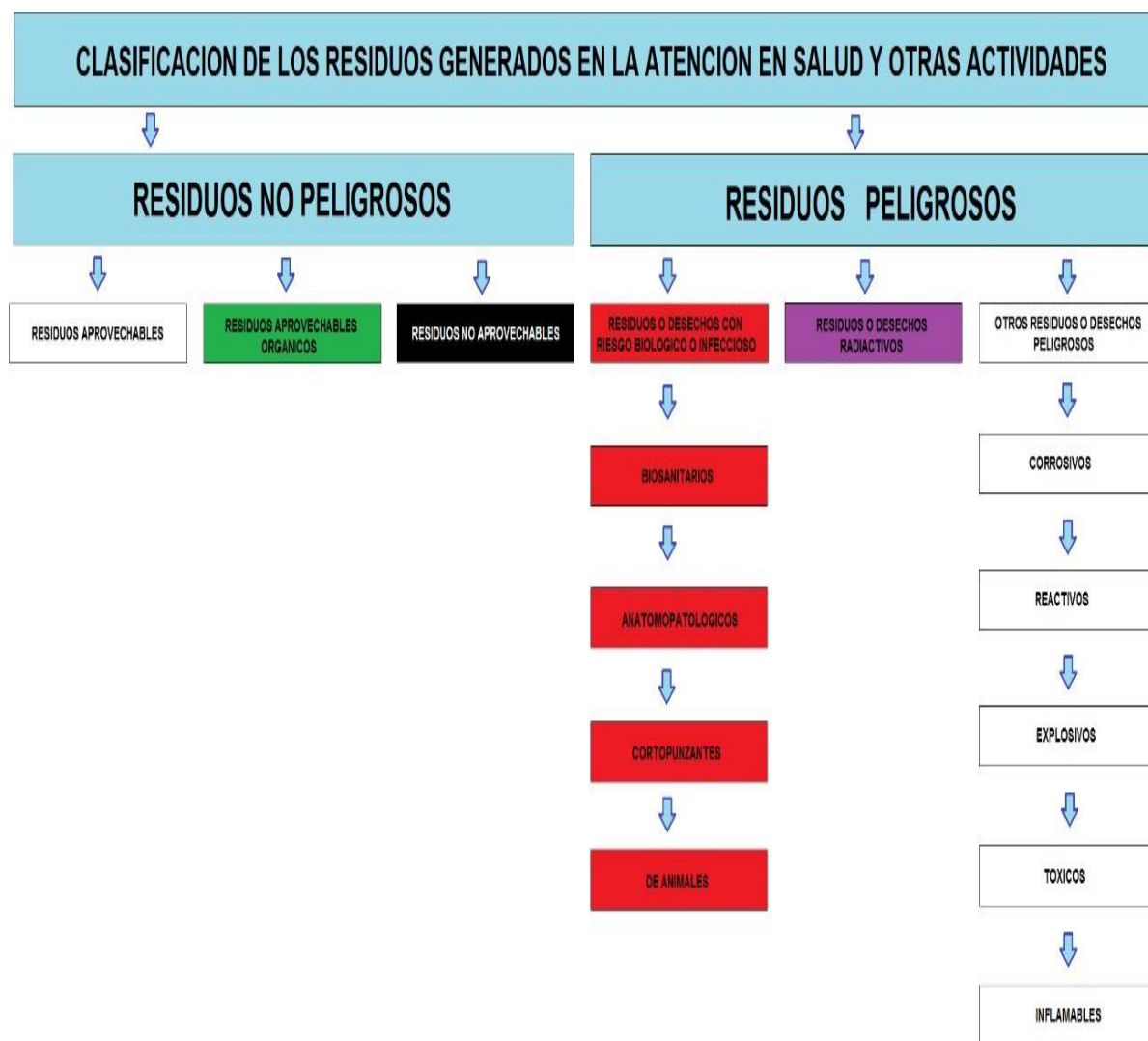
Figura No. 4.1. Clasificación de residuos generados en atención en salud y otras actividades.