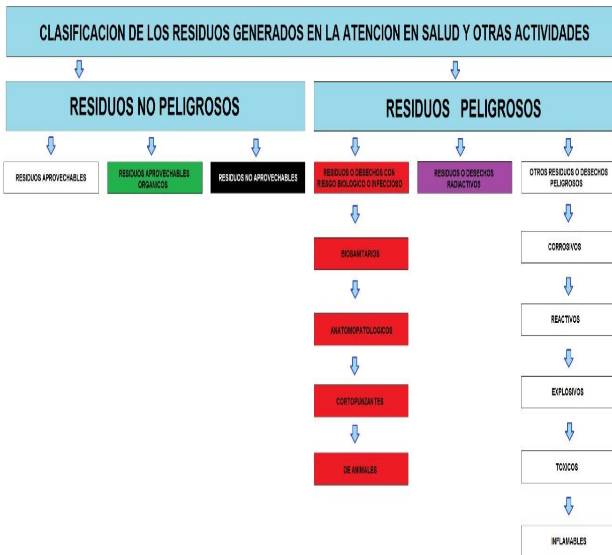
Figura No. 4.1. Clasificación de residuos generados en atención en salud y otras actividades.

Identificación, clasificación y cuantificación de los residuos generados.