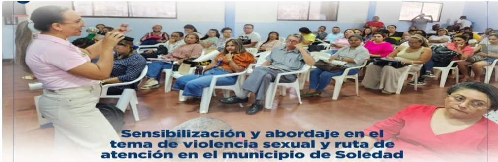
Sensibilización y abordaje en el tema de violencia sexual y ruta de atención en el municipio de Soledad

16. Realizar talleres lúdicos-pedagógicos, dirigido al menos 50 personas entre rectores, educadores y coordinadores académicos y disciplinarios de los colegios públicos y privados del municipio de Soledad, sobre la ruta de atención a las víctimas de violencia sexual y agentes químicos.